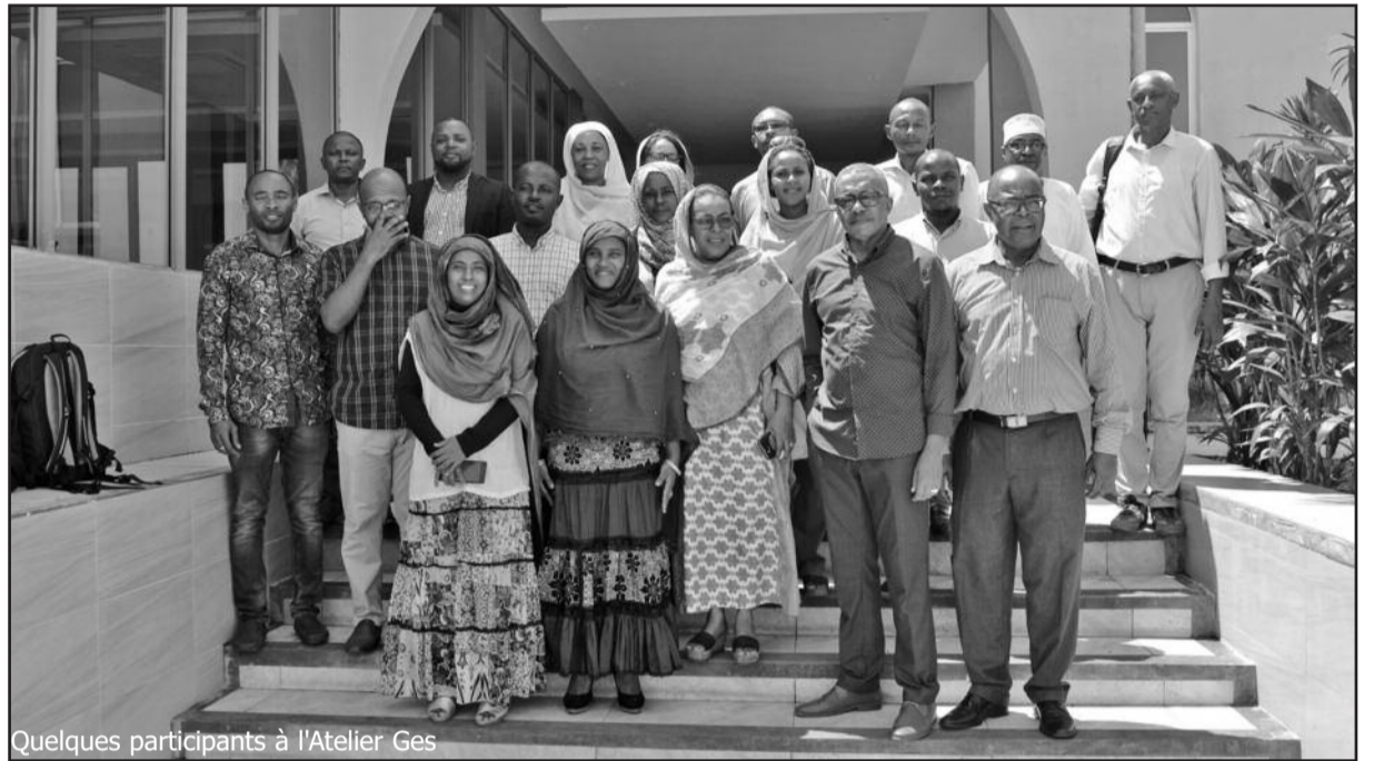
Quelques participants à l'Atelier Ges

Moroni a adhéré au programme du Pacte des Maires en 2015, démontrant ainsi son engagement à réduire ses émissions GES, ainsi qu'à identifier et aborder les risques de changement climatique pour la ville selon les exigences de conformité du Badge 1 de la CMMCE. Par la suite, Moroni a demandé l'appui de l'ONU-Habitat pour atteindre ses objectifs d'obtention de tous les quatre badges de vérification, devenir totalement conforme au Pacte des Maires, et jouer son rôle en tant qu'une ville faisant partie de la Convention Mondiale des Maires pour le Climat et l'Énergie