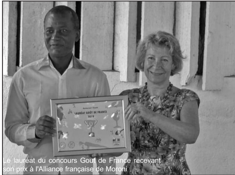
Le lauréat du concours Gout de France recevant son prix à l'Alliance française de Moroni