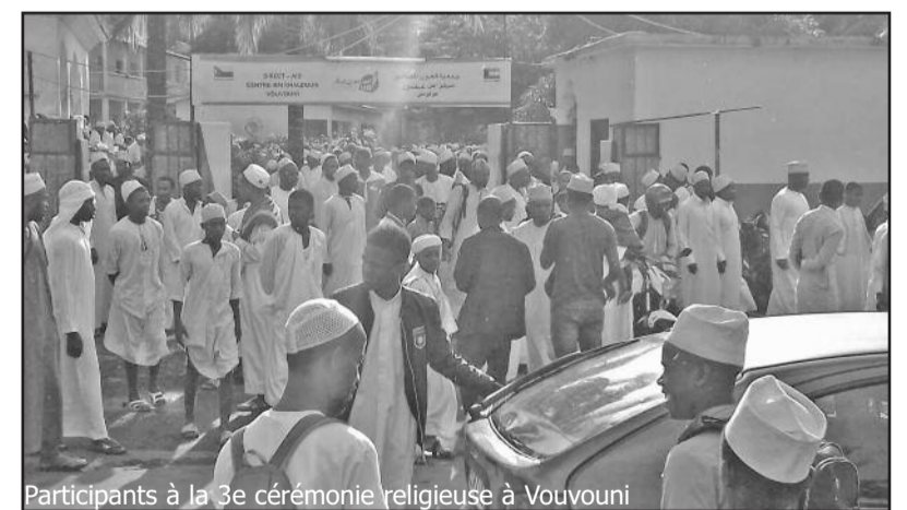
Participants à la 3e cérémonie religieuse à Vouvouni

Et à l'aube du 3e jour tel qu'aujourd'hui (7 avril) a-t-il conclu, tout